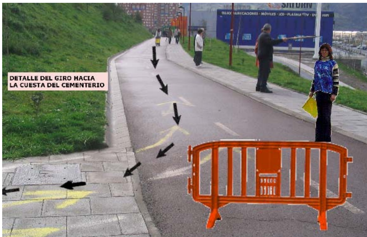
Otro detalle del giro